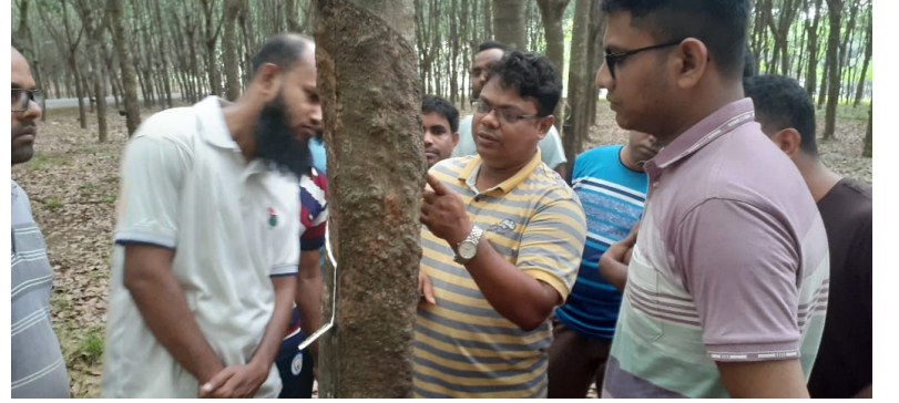
নব নিয়োগপ্রাপ্তদের রাবার গাছ টেপিং সংক্রান্ত প্রশিক্ষণ