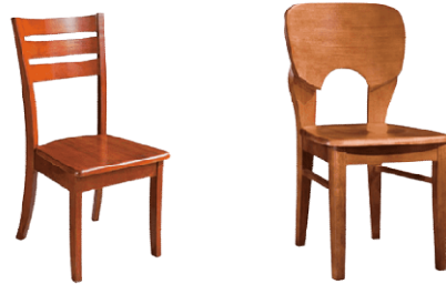
চিত্র: হাতল ছাড়া চেয়ার