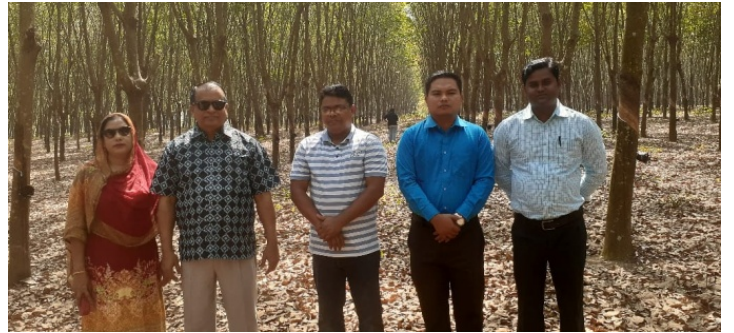
চেয়ারম্যান মহোদয় কর্তৃক দাঁতমারা রাবার বাগানের উৎপাদনশীল এলাকা পরিদর্শন