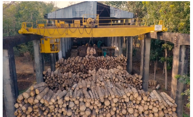
শিল্প ইউনিটে স্তুপকৃত কাঠ