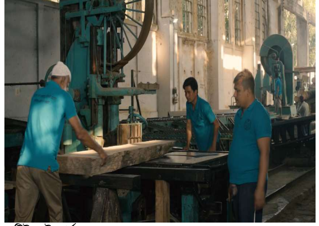
এলপিসি কণ্ডাই এর ট্রিটমেন্ট কার্যক্রম