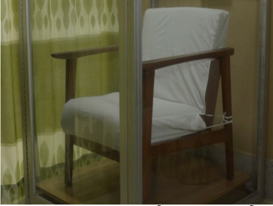
রামু রাবার বাগান, কক্সবাজারে সংরক্ষিত বঙ্গবন্ধু শেখ মুজিবুর রহমান এর ব্যবহৃত চেয়ার

রামু রাবার বাগানটি কক্সবাজার জেলার রামু থানায় চট্টগ্রাম-কক্সবাজার মহাসড়কের পার্শ্বে অবস্থিত। পাহাড়ী এলাকায় এক মনোমুগ্ধকর পরিবেশে বাংলাদেশ বন বিভাগ কর্তৃক পরীক্ষামূলকভাবে ১৯৬০-৬১ খ্রি. ৩০.০০ একর বাগান সৃষ্টির মাধ্যমে এ বাগানের কার্যক্রম শুরু হয়। বর্তমানে বাগানের মোট আয়তন ২৬৮২.০০ একর। তন্মধ্যে উত্তোলিত বাগান এলাকা ২২০৮.০০ একর এবং অফিস, বাসা বাড়ী, রাস্তা ও অন্যান্য এলাকার পরিমাণ ৪৭৪.০০ একর। এ বাগানে (২০২১-২২ অর্থবছরে) বাৎসরিক উৎপাদন প্রায় ১৮২.৬০ মে. টন।