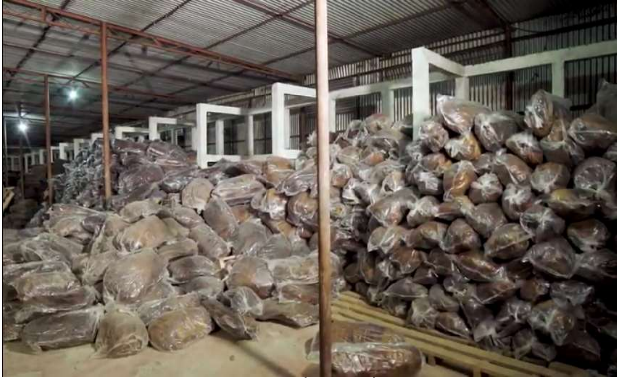
গোড়াউনে সংরক্ষিত রাবার বান্ডিল

রাবারের সমাপনী মজুদের মূল্য = ১৪,৪৮,৪২,০৮১.৬০ (চৌদ্দ কোটি আটচল্লিশ লক্ষ বিয়াল্লিশ হাজার একাশি টাকা ষাট পয়সা)।