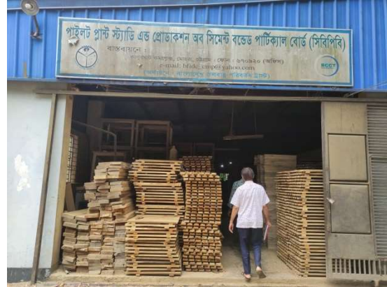
শিল্প ইউনিটে ফার্নিচার তৈরির কাঠ