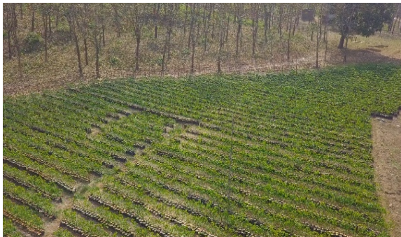
সৃজিত রাবার নার্সারী