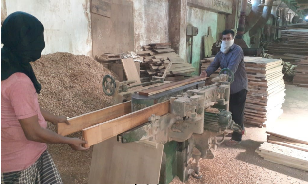
মেশিনের সাহায্যে কাঠ বিভিন্ন সাইজের করা হচ্ছে।