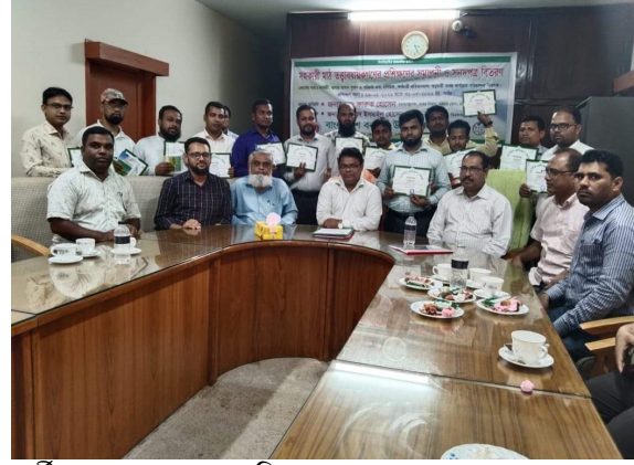
রাবার ট্রেনিং সেন্টারে প্রশিক্ষণার্থীদের ব্যাগ ও সনদ বিতরণ