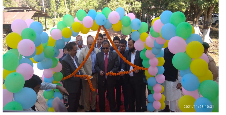
কাঠ সংরক্ষণ ইউনিটের পাওয়ার স্টেশন উদ্বোধন