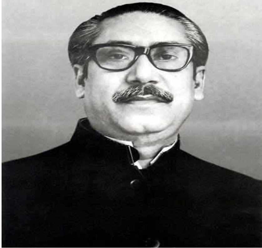
বঙ্গবন্ধু শেখ মুজিবুর রহমান

১৯৫৯ খ্রি. প্রকাশিত ৬৭নং অধ্যাদেশ বলে বাংলাদেশ বনশিল্প উন্নয়ন কর্পোরেশন (বিএফআইডিসি) প্রতিষ্ঠিত হয়। এটি পরিবেশ, বন ও জলবায়ু পরিবর্তন মন্ত্রণালয়ের নিয়ন্ত্রণাধীন একটি স্বায়ত্তশাসিত প্রতিষ্ঠান। এই প্রতিষ্ঠানটি সুপ্রতিষ্ঠিত করার জন্য জাতির পিতা বঙ্গবন্ধু শেখ মুজিবুর রহমানের অবদান অনস্বীকার্য। তিনি বিএফআইডিসি'র সূচনালগ্নে প্রতিষ্ঠানের স্থায়ী কার্যালয়ের জন্য ৭৩, মতিঝিল বাণিজ্যিক এলাকায় অবস্থিত বর্তমান ভবনটির জমি বরাদ্দ করেছিলেন। তিনি স্বপ্ন দেখেছিলেন সোনার বাংলায় দারিদ্র্য বিমোচনের পরিবেশ বান্ধব কর্মসংস্থান। তারই ধারাবাহিকতায় সেই স্বপ্নের উপর ভিত্তি করে ২০৪১ খ্রিস্টাব্দের মধ্যে বাংলাদেশকে উন্নত দেশে উত্তরণের লক্ষ্যে বিএফআইডিসি নিরন্তর কাজ করে চলেছে।