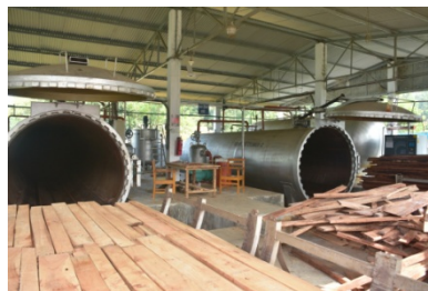
রাবার কাঠ প্রেসার ট্রিটমেন্ট প্লান্ট এর ট্রিটমেন্ট সিলিন্ডারে সাইজ কাঠ