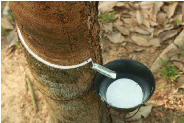
বাটিতে রাবার কষ (ল্যাটেক্স) সংগ্রহ