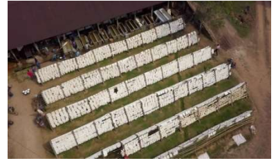
কারখানায় ড্রিপিং শেডে রাবার শীট