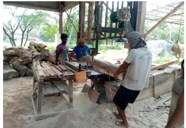
স-মেশিনে রাবার গাছ সাইজ