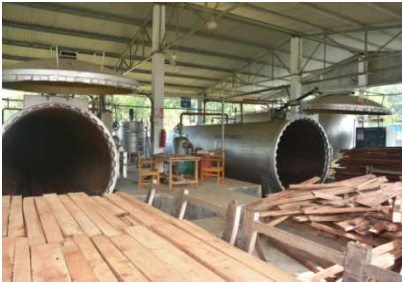
রাবার কাঠ ড্রিটমেন্ট প্লান্ট