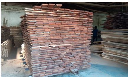
রাবার সাইজ কাঠ