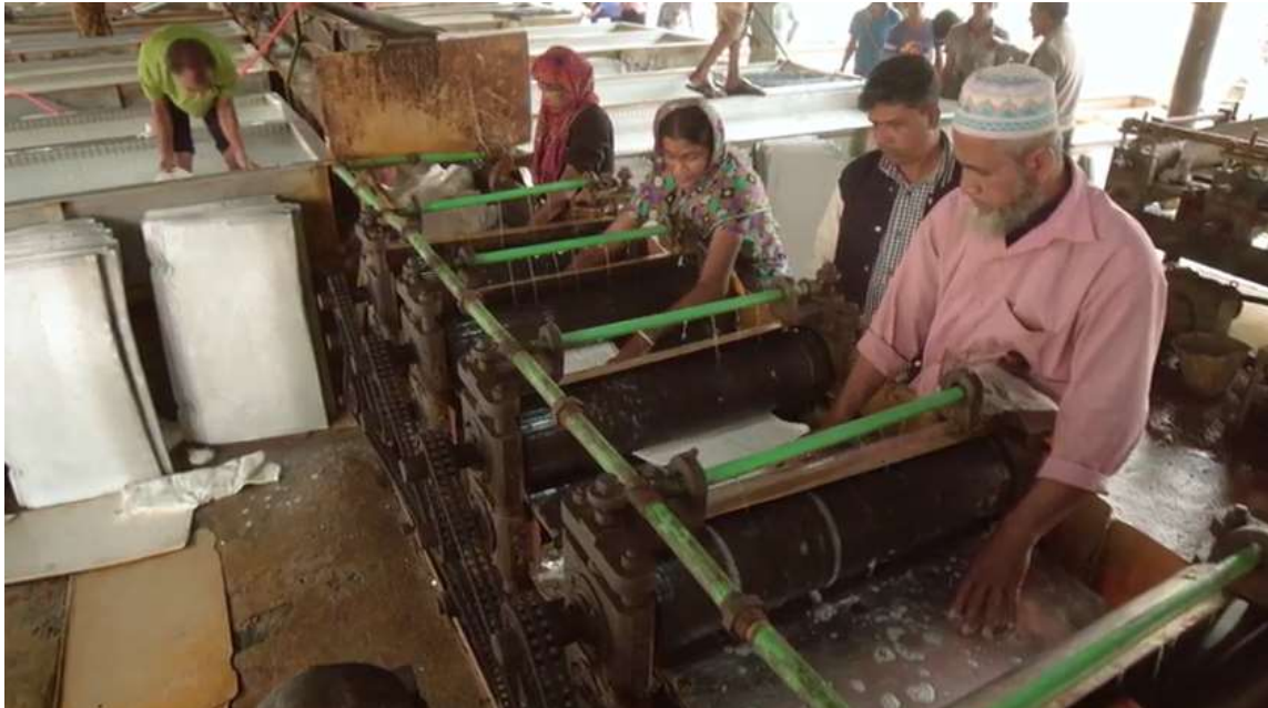
রোলার মেশিনে রাবার শীট রোলিং