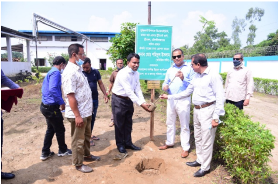
রাবার কাঠ প্রেসার ট্রিটমেন্ট প্লান্ট, শ্রীমঙ্গল পরিদর্শন ও গাছের চারা রোপন