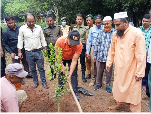
চাঁদপুর রাবার বাগানের অফিসের সামনে ফলজ গাছ রোপন করছেন চেয়ারম্যান মহোদয়