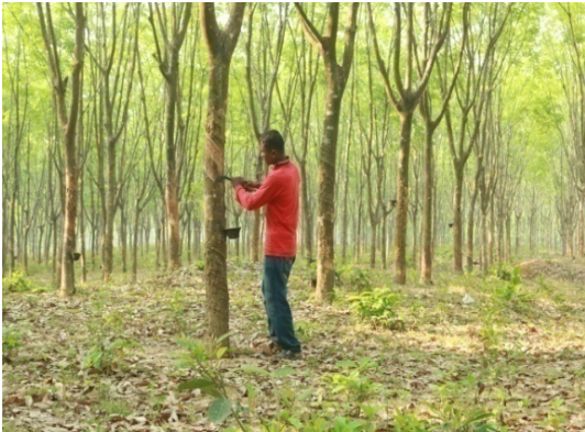
রাবার গাছ টেপিং প্রক্রিয়া