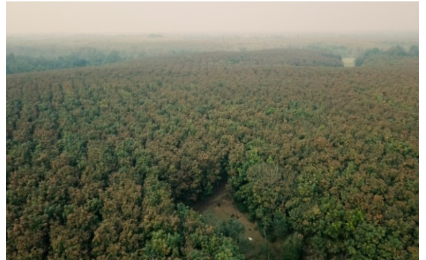
ড্রোনে ধারণকৃত রাবার বাগান