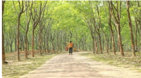
রাবার বাগানের চিত্র