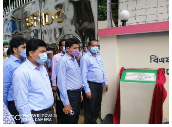
সিএমপি, মিরপুরে নব নির্মিত গেইট ও বাউন্ডারী উদ্বোধন।