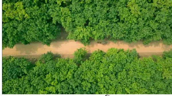
রাবার বাগানের অভ্যন্তরীণ রাস্তা