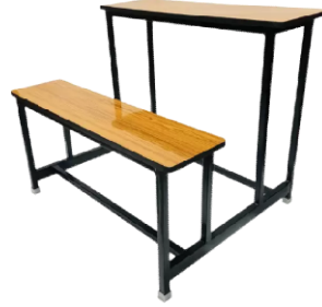
চিত্র: হাই ও লো বেঞ্চ