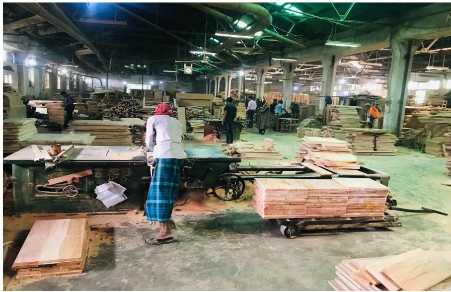
ফিডকো ফার্নিচার কমপ্লেক্সে কর্মরত শ্রমিক