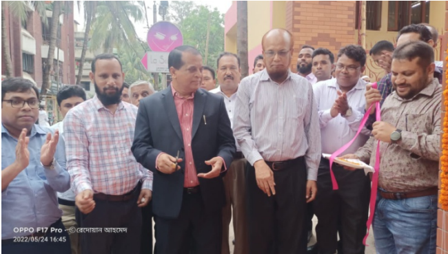
চট্টগ্রাম জোনের প্রধান ফটক উদ্বোধন করছেন চেয়ারম্যান মহোদয়