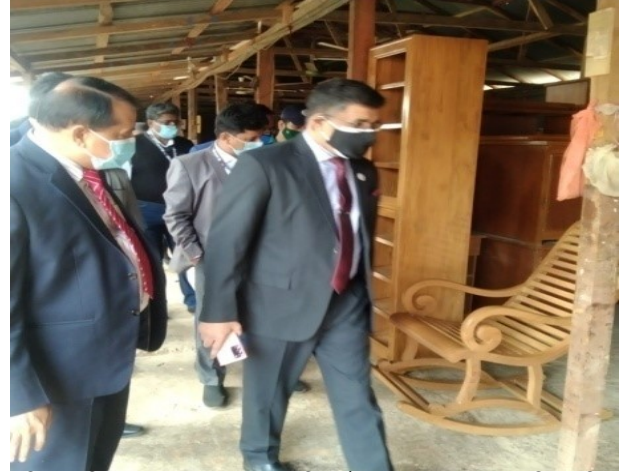
সচিব, পরিবেশ, বন ও জলবায়ু পরিবর্তন মন্ত্রণালয় মহোদয় সিএমপি, মিরপুর ইউনিট পরিদর্শন করেন