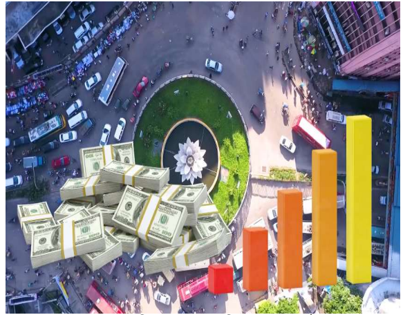
রাবার রপ্তানি করে বৈদেশিক মুদ্রা অর্জন।