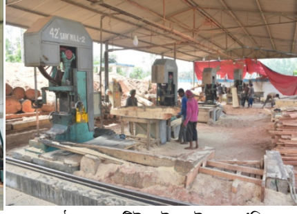
রাবার কাঠ প্রেসার ট্রিটমেন্ট প্লান্ট এর সঁমিল