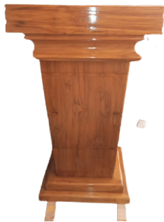
চিত্র: স্পীকার টেবিল (ডায়াচ)