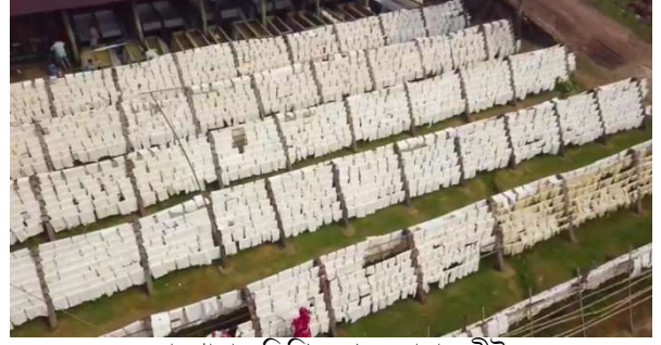
কারখানায় ড্রিপিং শেডে রাবার শীট