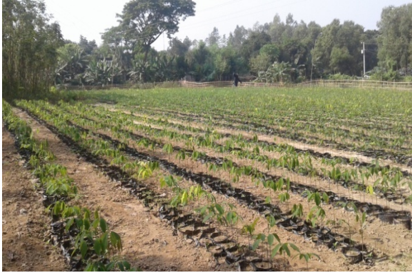
রাবার চারার নার্সারী