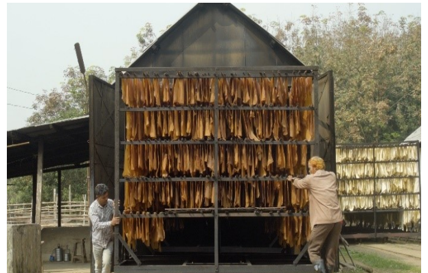
ধুমঘরে ধূমায়িত রাবার শীট