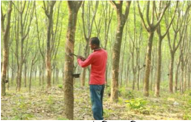
রাবার গাছ টেপিং প্রক্রিয়া