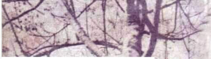
১১ ফেব্রুয়ারি ১৯৭৫ খ্রি. জাতির জনক বঙ্গবন্ধু শেখ মুজিবুর রহমান ঐর রামু রাবার বাগানে টেপিং কার্যক্রম পরিদর্শন