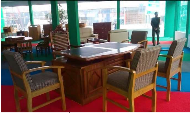
রাবার কাঠ হতে তৈরিকৃত ফার্নিচার