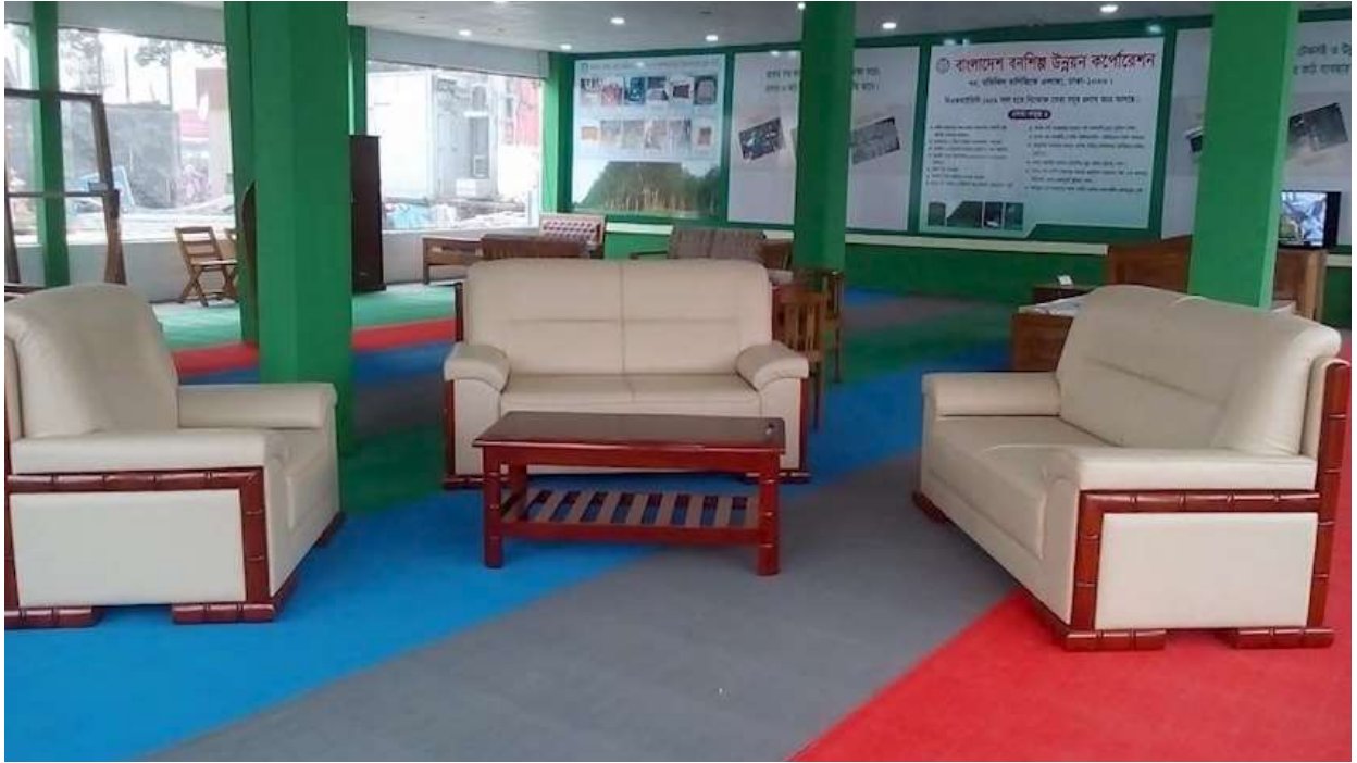
বিএফআইডিসি'র শিল্প সেক্টরের তৈরি আসবাবপত্র