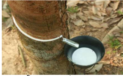
বাটিতে কষ (ল্যাটেক্স) সংগ্রহ