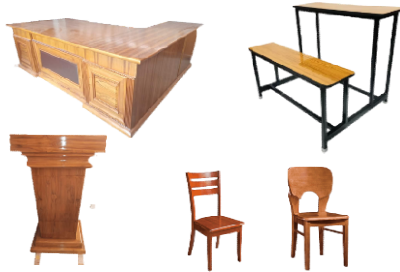
রাবার কাঠের আসবাবপত্র