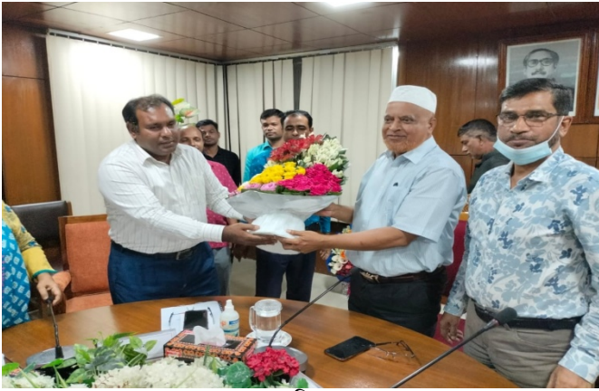
নব যোগদানকৃত সচিব মহোদয়কে বরণ