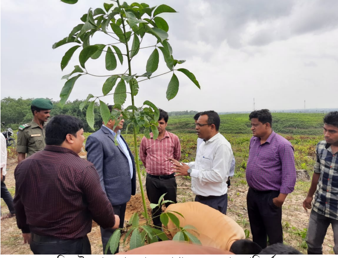
সিলেট জোনে পুনঃবাসন বাগান সৃজন কাজ পরিদর্শন