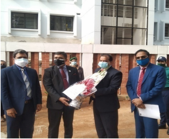
সচিব, পরিবেশ, বন ও জলবায়ু পরিবর্তন মন্ত্রণালয় মহোদয়কে সিএমপি, মিরপুর কার্যালয়ে বরণ করে নিচ্ছেন চেয়ারম্যান, বিএফআইডিসি, মহোদয়