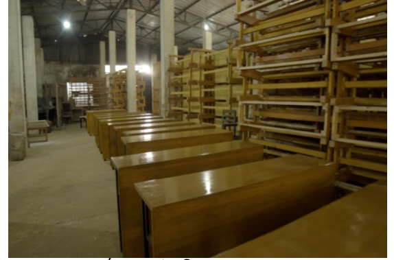
কাঠ থেকে তৈরিকৃত আসবাবপত্র