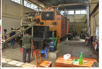
রাবার কাঠ প্রেসার ট্রিটমেন্ট প্লান্ট এর বয়লার