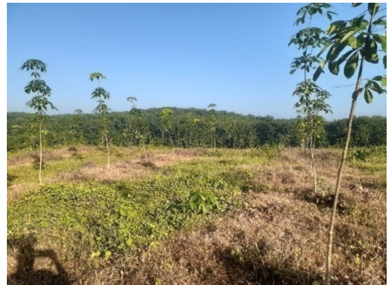
পুনঃ বাগান সৃজন