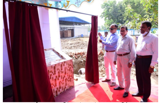
রাবার কাঠ প্রেসার ট্রিটমেন্ট প্লান্ট এর ফার্নিচার ও স'মিল সেড নির্মাণ এর ভিত্তিপ্রস্থর স্থাপন।