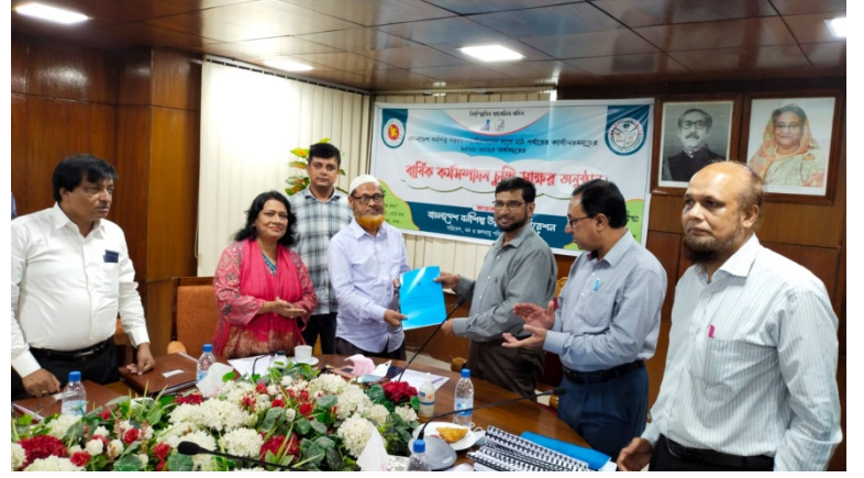
সদর দপ্তর, ঢাকায় এপিএ স্বাক্ষর অনুষ্ঠানে