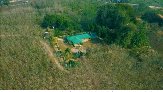
ড্রোন ক্যামেরায় ধারণকৃত রাবার বাগান ও কারখানা