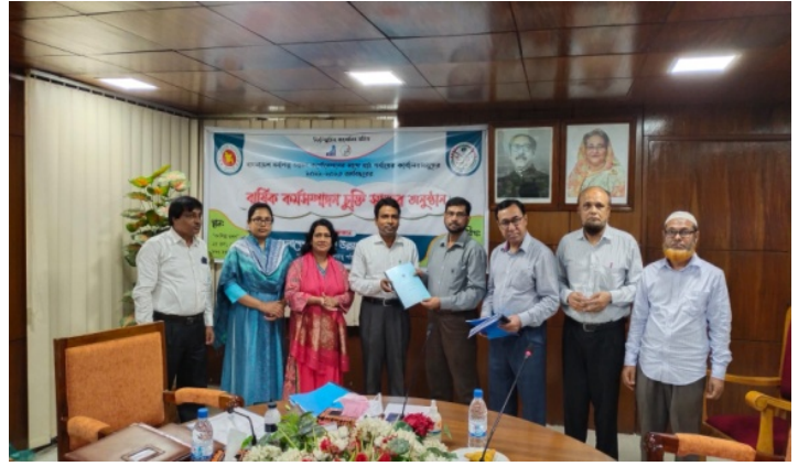
মাঠ পর্যায়ের কার্যালয়ের সাথে এপিএ স্বাক্ষর অনুষ্ঠান