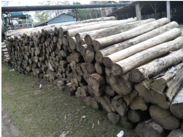
সাইজকৃত রাবার গাছ