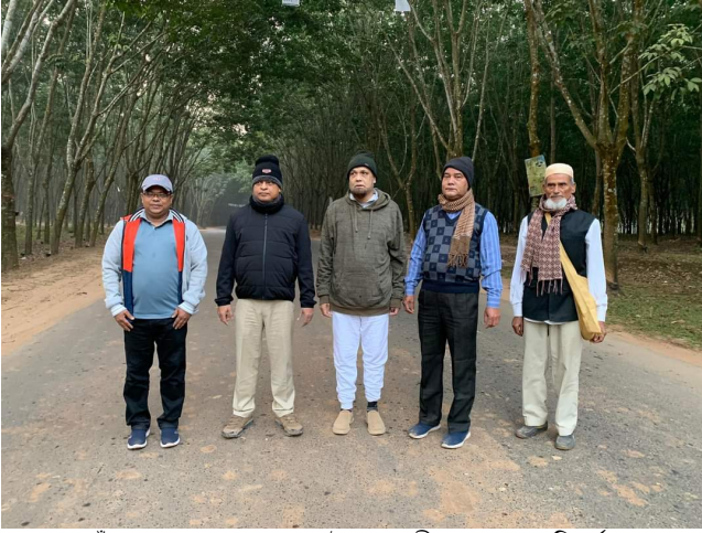
দাঁতমারা রাবার বাগানের উৎপাদনশীল এলাকা পরিদর্শন