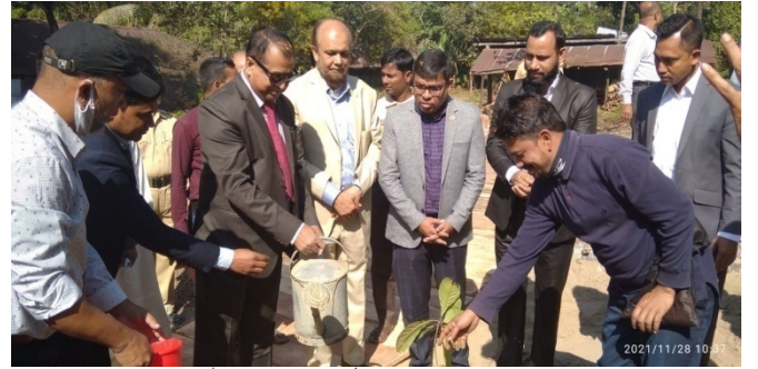
কালুরঘাট মহাপ্রকল্প, চট্টগ্রামে গাছের চারা রোপন