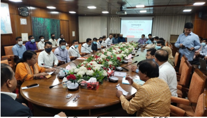
নবনিয়োগপ্রাপ্ত কর্মচারীদের ওরিয়েন্টেশন ক্লাস ও পরিচিতি সভায়