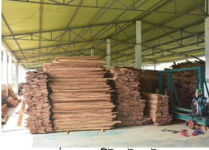
রাবার কাঠ প্রেসার ট্রিটমেন্ট প্লান্ট এর প্রক্রিয়াজাতকৃত রাবার কাঠ