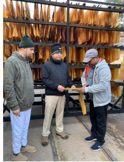
বিএফআইডিসি'র চেয়ারম্যান ও চট্টগ্রাম জোনের মহাব্যবস্থাপক কর্তৃক দাঁতমারা রাবার বাগানের ধুমঘর পরিদর্শন