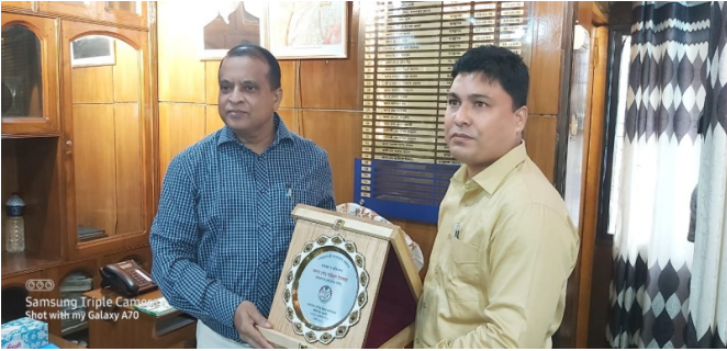
ইস্টার্ন উড ওয়ার্কস পরিদর্শন