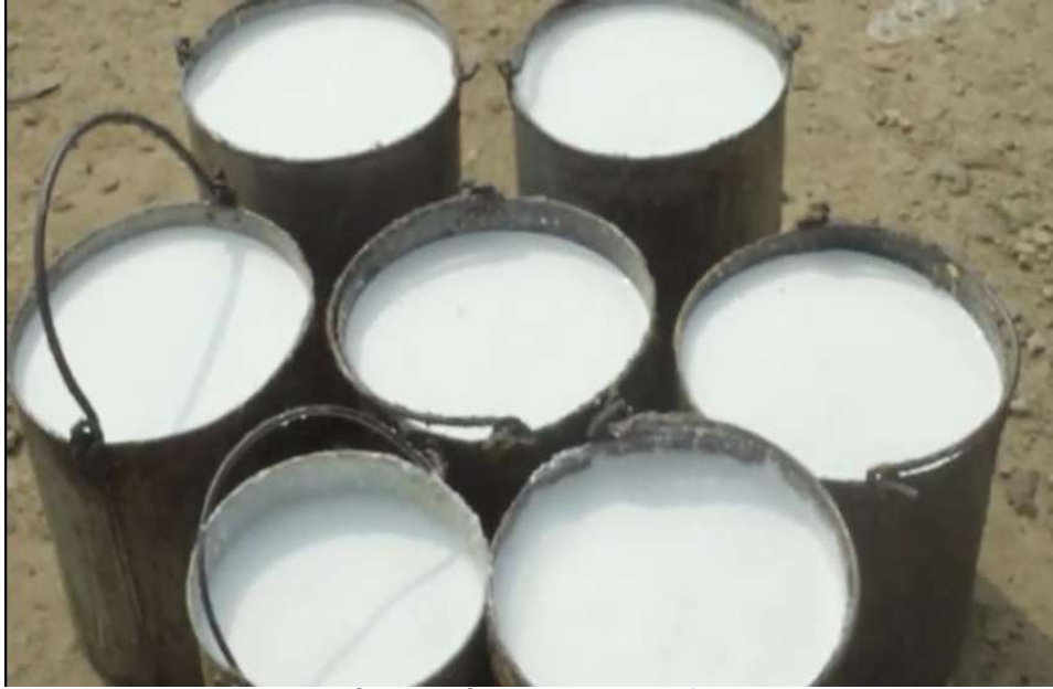
বালতিতে সংরক্ষিত রাবার কষ (ল্যাটেক্স)