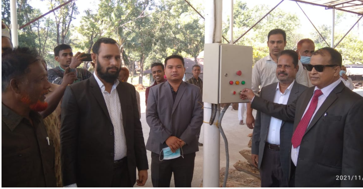
কাঠ সংরক্ষণ ইউনিট এর পাওয়ার স্টেশন উদ্বোধন।