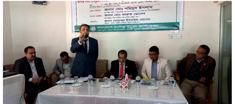
রাবার ট্রেনিং সেন্টার, চট্টগ্রামে প্রশিক্ষণ কর্মশালার উদ্বোধন