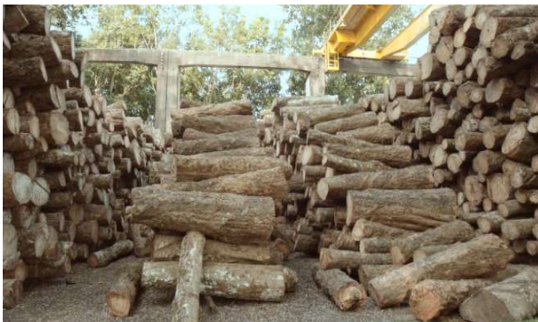
স-মিলে রাবার গাছের বিভিন্ন সাইজ