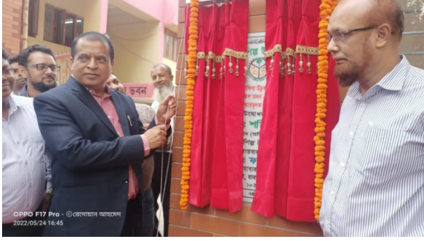
বিএফআইডিসি, রাবার বিভাগ, চট্টগ্রাম জোনের নবনির্মিত গেইট উদ্বোধন করেন কর্পোরেশনের চেয়ারম্যান মহোদয়।