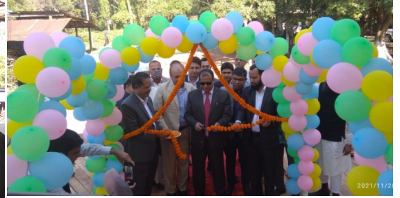
কালুরঘাট মহাপ্রকল্পের গেইট নির্মাণ কাজের ভিত্তি প্রস্থর স্থাপন।