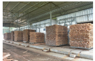
রাবার কাঠ প্রেসার ট্রিটমেন্ট প্লান্ট এর সিজনিং চেম্বার ও সিজনিং এর জন্য অপেক্ষারত সাইজ কাঠ